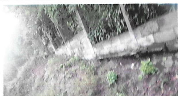
Foto 4: el muro se encuentra en el aire casi para derrumbarse debido a la humedad y antigüedad