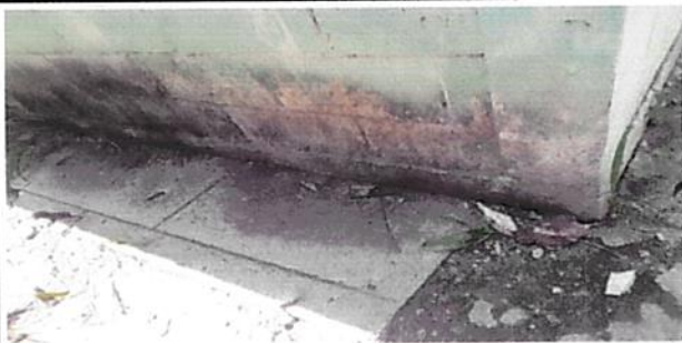
Foto 1: humedad en las paredes de las aulas por el agua que consume